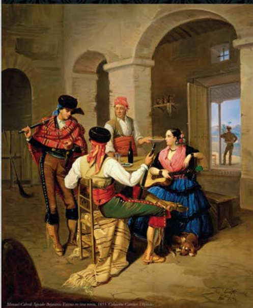
Manuel Cabral Aguado. Escena en una feria, 1833. Colección Casino Típicos.