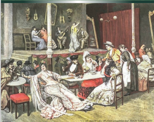
"Un café cantante", óleo del pintor costumbrista José Almán Sobres (1850)