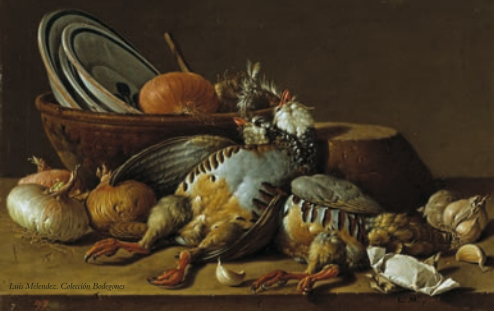
Luis Meléndez: Colección Bolívar