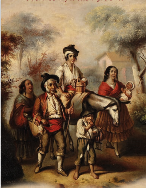
Familia en el camino Escuela Antológica del siglo XIX

Desde Ruedo Alameda hasta Calle San José